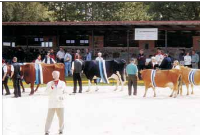
Foto 2. Eesti kaunimad lehmad Ülenurmel