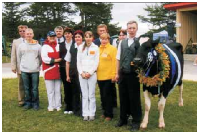
Foto 3. Tartu Agro AS võistkond 2007 Vissi Iirisega

Hobuste ekspositsioon oli viimaste aastate parim. Hobuslaste evolutsiooni ja aretussuundade mitmekesisust demonstreerisid areenil eesti raskeveo täkk Ekstron (turjakõrgus 174 cm) ja poni täkk Sam (tk 71 cm). Muuseas, rahvusvaheline andmebaas annab suurima elusoleva belgia raskeveo täku Radari turjakõrguseks 202 cm (kehamaas 1089 kg) ja poni Thumbalinal 51 cm (26 kg), erine-