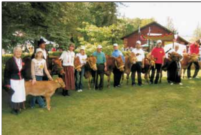
Foto 1. Eesti maakarja esindus